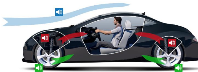
3 κύριες πηγές θορύβου στο εσωτερικό του οχήματος

Η λιγότερο θορυβώδης οδήγηση είναι και πιο άνετη. Υπάρχουν ωστόσο πολλά στοιχεία που δημιουργούν θόρυβο στο εσωτερικό του αυτοκινήτου: ο άνεμος, η ταχύτητα οδήγησης, οι οδικές συνθήκες, ο κινητήρας και οι δομικοί θόρυβοι, καθώς και τα ελαστικά. Όταν επιχειρείται μείωση του θορύβου στην καμπίνα, τα ελαστικά έχουν το μεγαλύτερο βαθμό συμβολής (τόσο αναφορικά με το κόστος όσο και το βάρος) συγκριτικά με άλλες μηχανολογικές λύσεις όπως το σύστημα ανάρτησης.